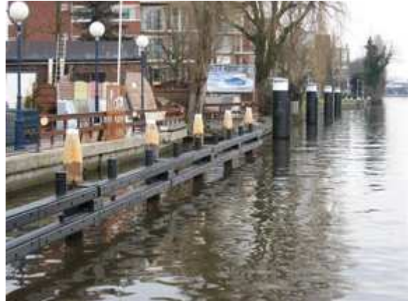
Foto 1: Gescheiden wachtplaats voor klein schip (voor) en groot schip

wachtplaats voor meerdere bruggen gecombineerd. Wachtplaatsen liggen doorgaans in een veiligheidszone.