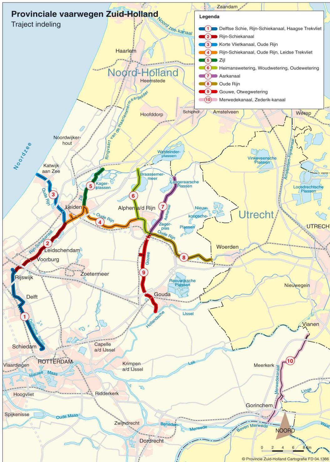
Figuur 1: Overzichtskaart provinciale vaarwegen Zuid-Holland, traject indeling