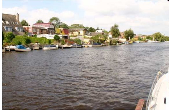
Foto 4: Ligplaatsen aan particuliere oevers zijn met ontheffing toegestaan buiten de vaarstrook, veiligheidsstrook of veiligheidszone

Bestaande (legale) ligplaatsen aan particuliere oevers, die op grond van de nieuwe uitgangspunten niet wenselijk zijn (ze liggen geheel of gedeeltelijk binnen een vaarstrook en/of veiligheidsstrook en/of veiligheidszone), worden passief uitgefaseerd. Dit houdt in dat reeds verleende ontheffingen stand houden. Wanneer voor dezelfde plek een nieuwe aanvraag komt (bijvoorbeeld bij wisseling van perceeleigenaar) wordt echter geen ontheffing meer verleend.